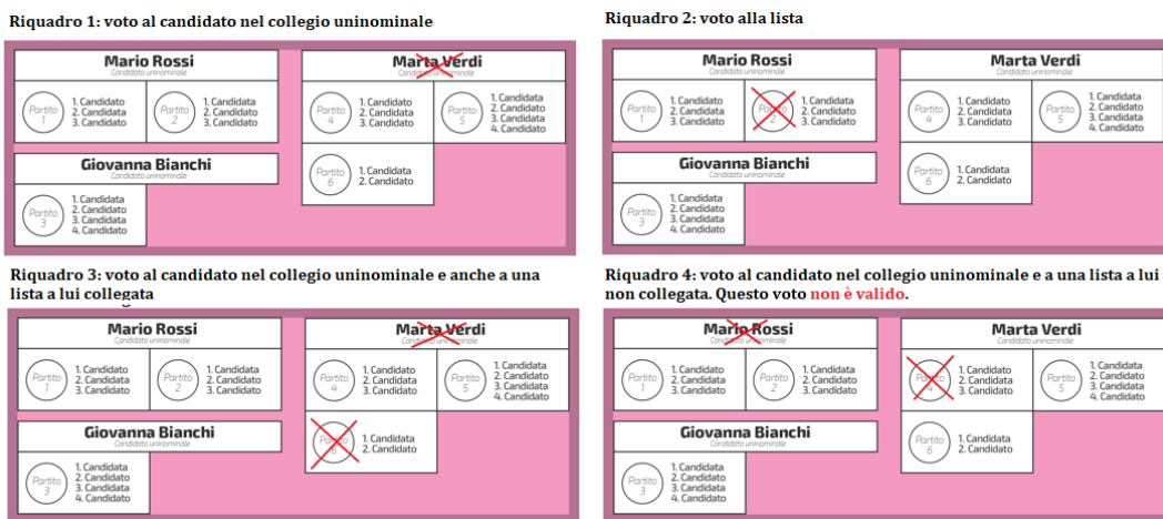
Figura 3 – Fac-simile di una scheda elettorale e validità del voto espresso

Nel momento in cui l'elettore ha espresso la sua scelta, tutto ciò che segue è rimandato agli scrutini nelle singole sezioni elettorali (sono 61.554 in tutt'Italia) e alla traduzione dei voti in seggi che è demandata agli uffici elettorali circoscrizionali e nazionale. Nei prossimi paragrafi illustreremo proprio il cuore del sistema elettorale, ovvero la trasformazione delle scelte degli elettori in seggi parlamentari.